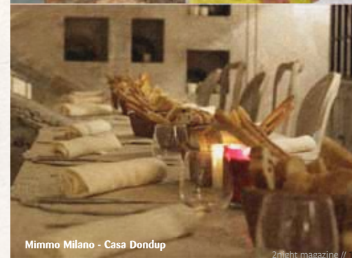
Mimmo Milano - Casa Dondup