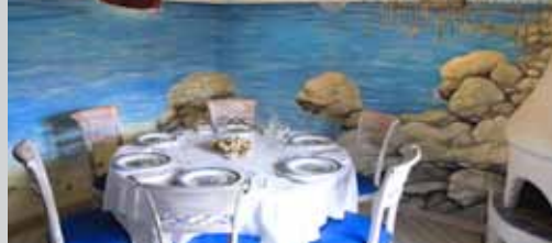
Via G. Marconi, 6 - Rosciano (PE). Info: 0858505295, 3277736227.

Tradizione alimentare abruzzese, in una casa colonica dell'800, con un tocco di creatività. Piatti con prodotti a km zero scelti da agricoltori e allevatori locali. Ogni mese il menù degustazione offre profumi e colori di stagione. Le sale richiamano le peculiarità del territorio abruzzese: mare, campagna, grano, ulivo, vino. Nella carta dei vini la sapienza enologica abruzzese.