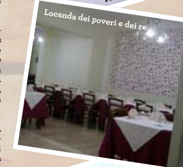
Locanda dei poveri e dei re