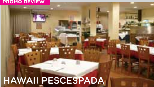
V.le della Riviera, 154 - Pescara. Info: 0854713094, 3291065250.

Ampio salone adatto alle tavolate fra amici, ma non mancano spazi più riservati per una serata in coppia. Propongono piatti di mare della tradizione locale, dagli antipasti (crudi, freddi, caldi) a seconda del pescato, primi come spaghetti alle vongole e secondi fino a brodetto e guazzetto. C'è anche la pizza cotta nel bel forno a legna. Perfetto per feste private e cerimonie con veranda sul mare.